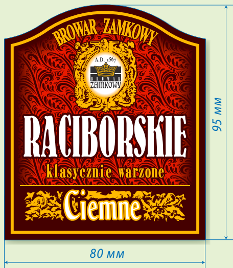
ЕТИКЕТКА НА СКЛЯНУ ПЛЯШКУ